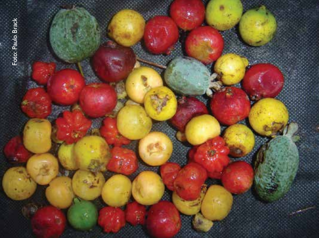
Diversidade de frutas nativas na colheita: feijoa, araçá-amarelo, araçá-vermelho, pitanga e butiá

pécie. A principal estratégia tem sido a produção de polpa dos frutos da juçara, o que contribui para a sua manutenção nas florestas, uma vez que para essa atividade não é necessário matar as plantas. A produção de polpa gera grande quantidade de sementes que são utilizadas para repovoar as florestas. Soma-se a isso o alto valor nutricional dos alimentos que são produzidos com a polpa dos frutos. A bebida, explorada comercialmente como açaí de juçara ou açaí da Mata Atlântica , iguala-se ao açaí da Amazônia em termos de textura, cor e sabor mas pode superá-lo no que se refere ao teor de ferro, potássio e antocianinas.